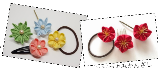
江戸つまみかんざし